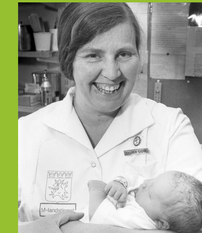
Förlossningen Lasarettet Ystad